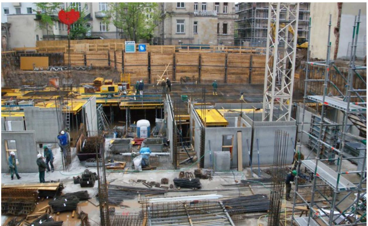
Tiefgarage im 3. und 4.UG